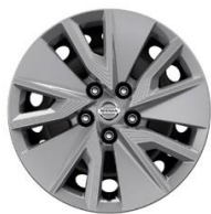
Visia 17" teräsvanteet (215/65 R17)