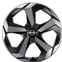
N-Connecta & Tekna 18" timanttileikatut kevytmetallivanteet (235/55 R18)