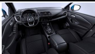
Visia & Acenta Mustat kangaspenkit