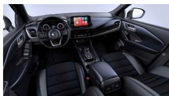
Tekna Lisävaruste N-Connecta Sinimustat kangas- ja keinonahkapenkit