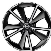
Tekna+ Lisävaruste N-Connecta ja Tekna 19" kevytmetallivanteet (235/50 R19)