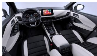
Lisävaruste Tekna Vaalean harmaat kangas- ja keinonahkapenkit