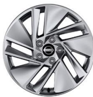
Acenta 17" kevytmetallivanteet (215/65 R17)