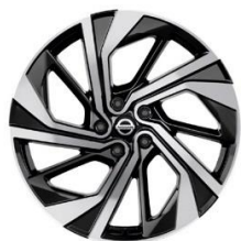
Lisävaruste Tekna+ 20" kevytmetallivanteet (235/45 R20)