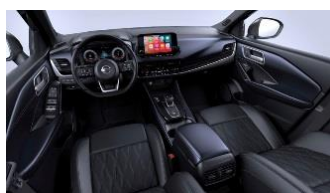
Tekna+ Sinimustat Nappanahkapenkit