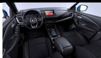
N-Connecta Harmaat kangaspenkit